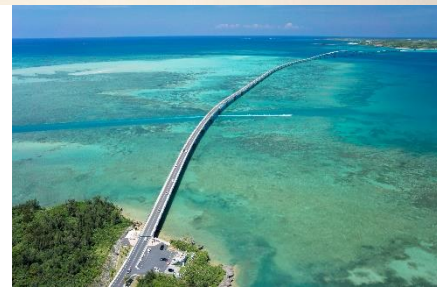
伊良部大橋(イメージ)