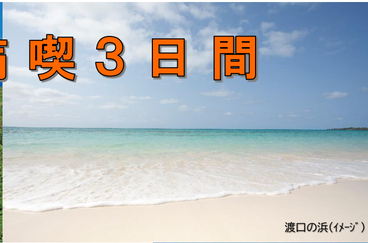
渡口の浜(イメージ)