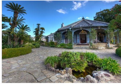
グラバー園 旧グラバー住宅 (伊-ジ)